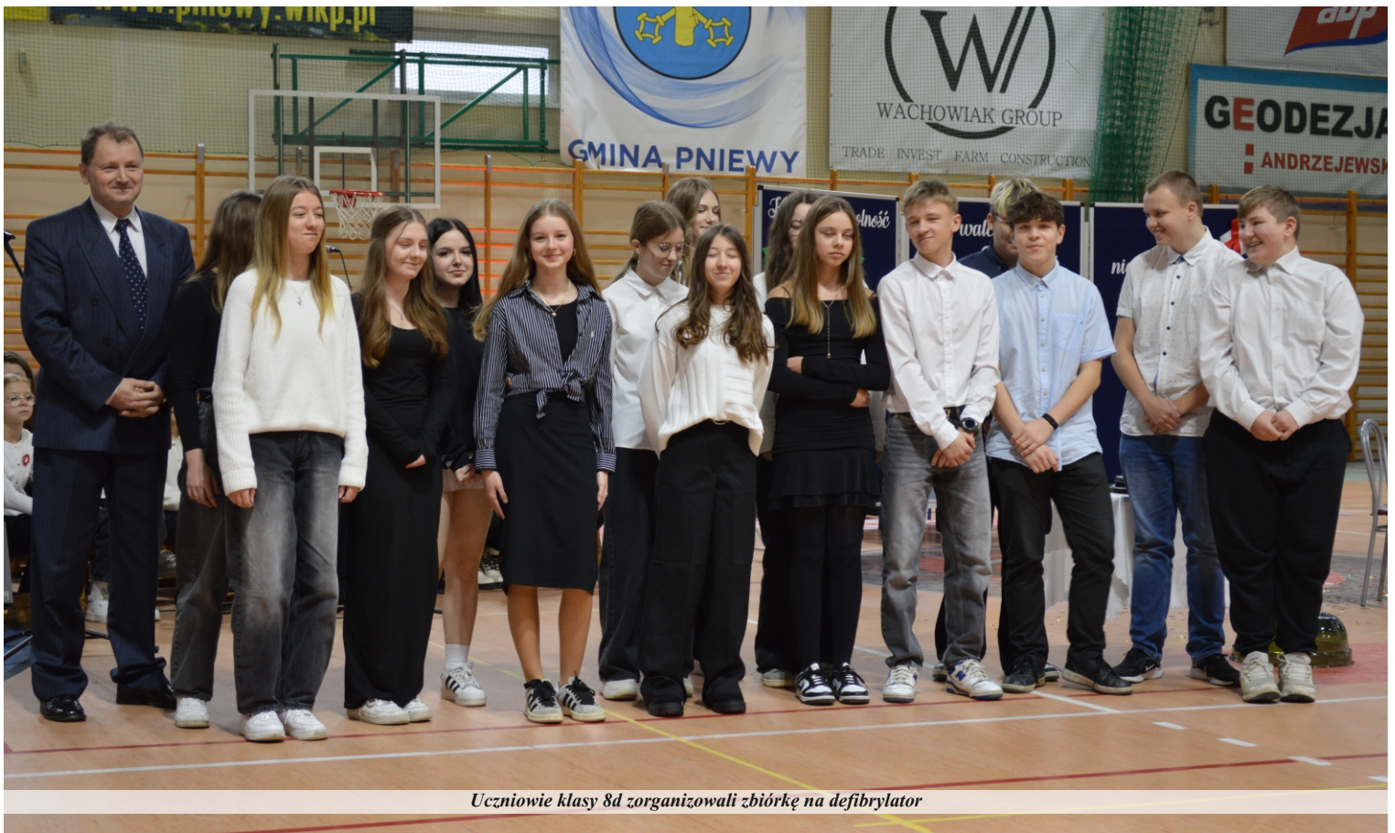
Uczniowie klasy 8d zorganizowali zbiórkę na defibrylator