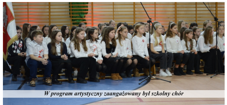
W program artystyczny zaangażowany był szkolny chór

Po części oficjalnej uczniowie szkoły przedstawili program artystyczny, nawiązujący do wydarzeń z lat 1918-1919.