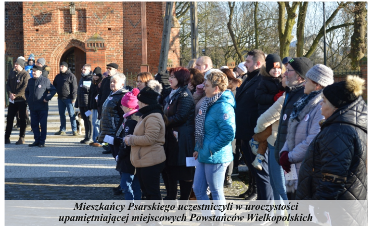
Mieszkańcy Psarskiego uczestniczyli w uroczystości upamiętniającej miejscowych Powstańców Wielkopolskich